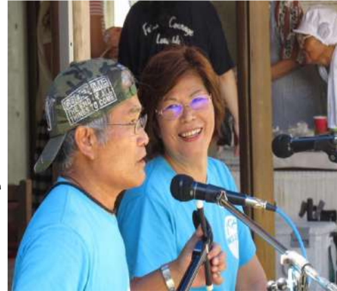
白保日曜市LIVE by横目研究所

LIVEの告知はFacebookでしか行ってないので、是非チェックしてください!