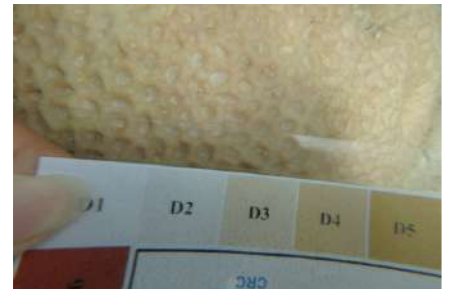
カラーチャートでD3のサンゴ