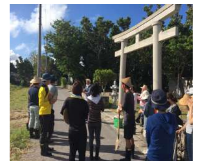
集落散策をする県職員労働組合の皆さん

プログラム内容は、赤土流出対策としての月桃植栽やシュノーケリング体験、サンゴに関するレクチャーや白保の伝統的な料理の試食、民泊に稼業体験、集落散策など、多岐にわたります。そういった白保の自然や文化、人々の暮らしぶりを体験、学習してもらうことが評価されています。大学のツアーや研修の受け入れに関しては、白保の小学校5年生から白保中学校2年生で構成している「しらほこどもクラブ」との交流も兼ねており、大学や専門学校などが無い石垣島では、この世代の学生たちと地域の子どもたちが関わり、ともに自然体験や文化体験をしていくことにより、子供たちの地域愛の向上や島の外について考える良い機会となっていると考えております。これからも白保地域の皆さまのご理解とご協力をお願いいたします。