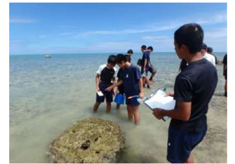
中学2年生コーラルウォッチ

今回の調査では、白保でもサンゴの白化がみられ、夏の調査時点ではサンゴ表面の色はだいぶ薄く、冬の調査ではある程度色が戻っていましたが、健康な色合いとは言えない状態であったように見えました。来年もまた、中学2年生が同様に調査をしていきたいと考えています。